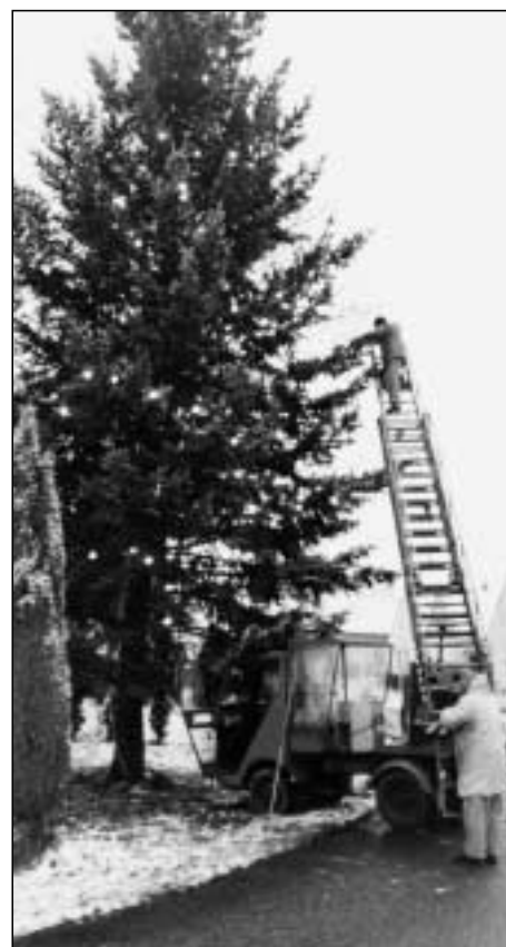
... a je po vánocích