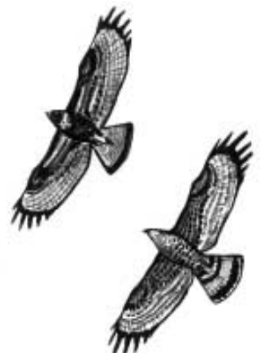
nahoře: káně lesní dole: včelojed lesní

obratlovci a vzácně i různé plody. Včelojedi s oblibou vyhrabávají podzemní hnízda lesních vos a odnášejí si celé pláсты, z nichž vybírají