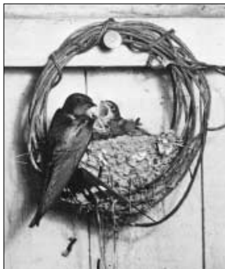
Vlašťovčí samička krmí svá mláďata

Za několik dnů až týdnů se vylíhnou mláďata ptáků. Tato doba, kdy vajíčka zahřívá buď samice nebo se střídá se samečkem, výjimečně zahřívá sameček (kivi), nebývá u všech ptáků stejně dlouhá. Asi 11 dnů je např. u pěnic, ale až 80 dnů u albatrosa. Zahřívání vajec u nekrmivých ptáků bývá delší než u krmivých. Mláďata krmivých ptáků jsou holá