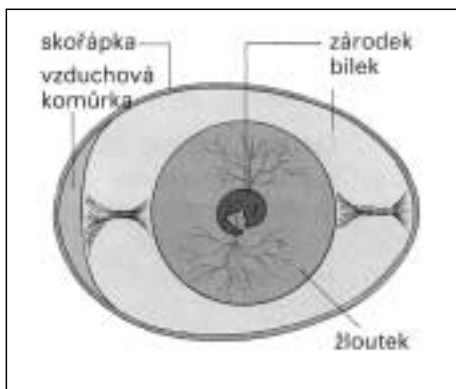
Nákres ptačího vejce

Ptáci se rozmnožují vejci, která jsou různě veliká a různě zbarvená. Každé vajíčko je chráněno několika obaly. Nejvrchnější obal je vápenatá skořápka. Barva této skořápky závisí na prostředí, neboť má většinou ochranný význam. Jsou vajíčka bílá, modrá, zelená, žlutá, červená, ale i různě skvrnitá, pruhovaná nebo tečkova-