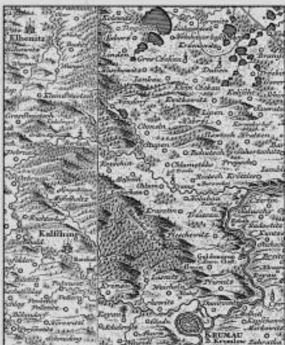
J. Ch. Müller: Mappa geographica regni Bohemiae 1720

k Evropskému dni parků ve čtvrtek 23. května 2002 ve 12.30 h. v rozhledně na Kletci