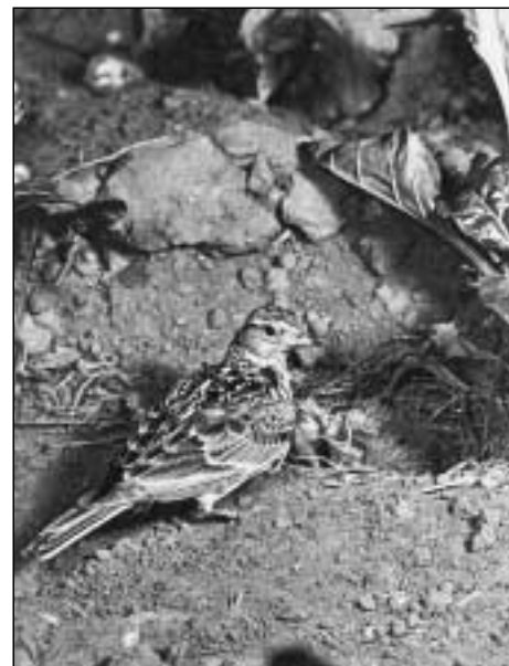
Skřivan polní s mláďaty

Larousse L.: Encyklopedie pro mládež, Albatros 1993