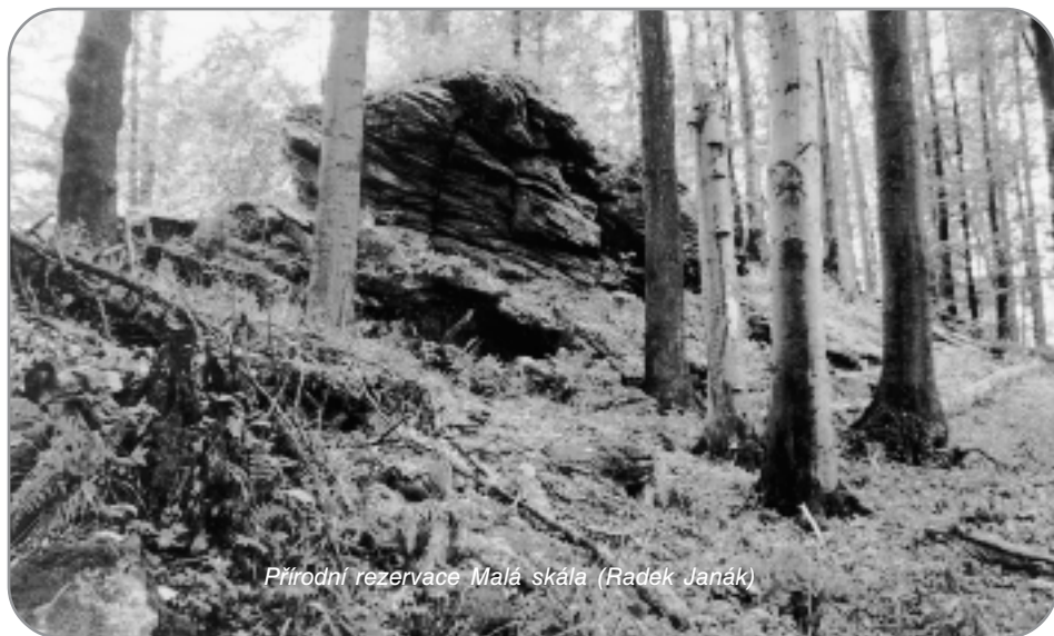
Přírodní rezervace Malá skála (Radek Janák)