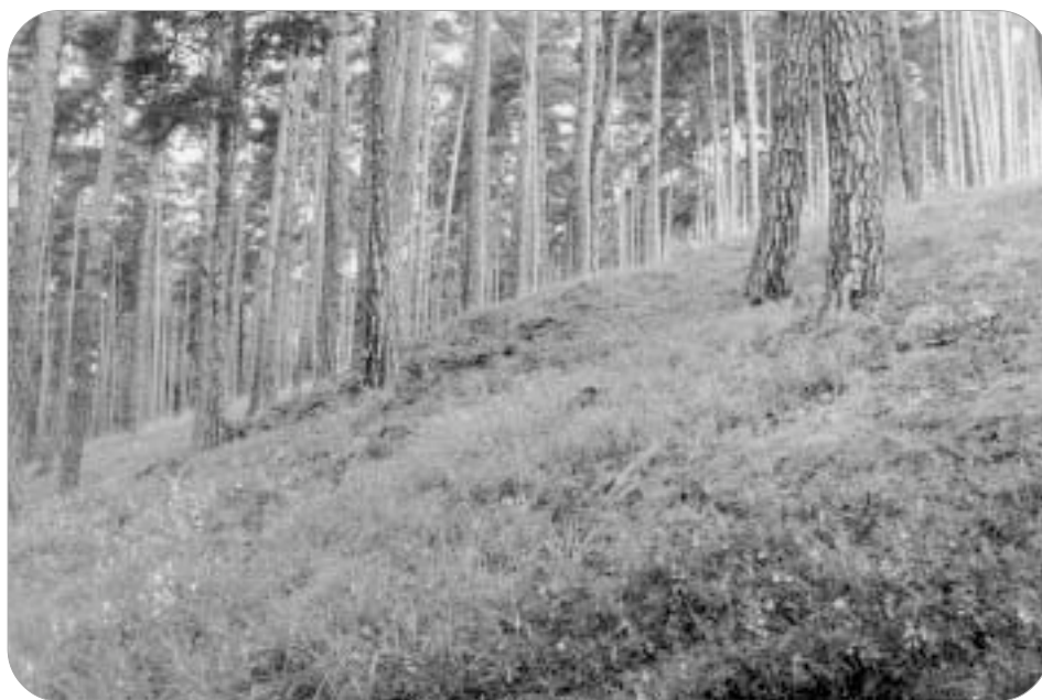
Přírodní rezervace Holubovské hadce

Dominujícím vegetačním typem na svazích s jižní expozicí jsou řídké hadcové bory, v nichž se vyskytují teplomilnější druhy. Stromové patro tvoří borovice lesní ( Pinus sylvestris ), ojediněle jsou vtroušeny i další dřeviny. V bylinném patře rostou nejčastěji kostřava ovčí ( Festuca ovina , rostliny se sivě ojněnými listy), bezkolonec ( Molinia caerulea agg.), válečka prapořitá ( Brachypodium pinnatum ), silenka nadmutá ( Oberna behen ), chrpa čekánek ( Colymbada scabiosa ), bělozářka větvitá ( Anthericum ramosum ), aj. Na skalkách se roztroušeně vyskytuje silně ohrožený sleziník hadcový ( Asplenium cuneifolium ). Mírnější severní svahy, kde hadec nevystupuje až k povrchu