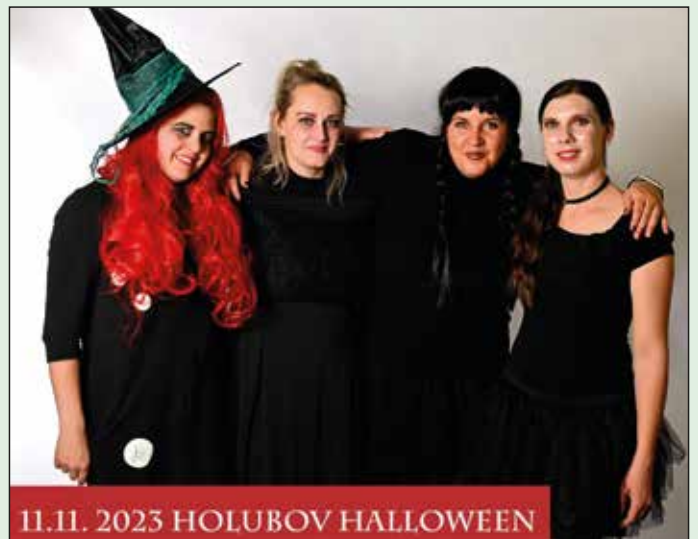
11.11. 2023 HOLUBOV HALLOWEEN