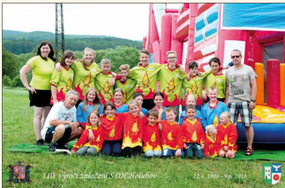
110. výročí založení SDH Holubov