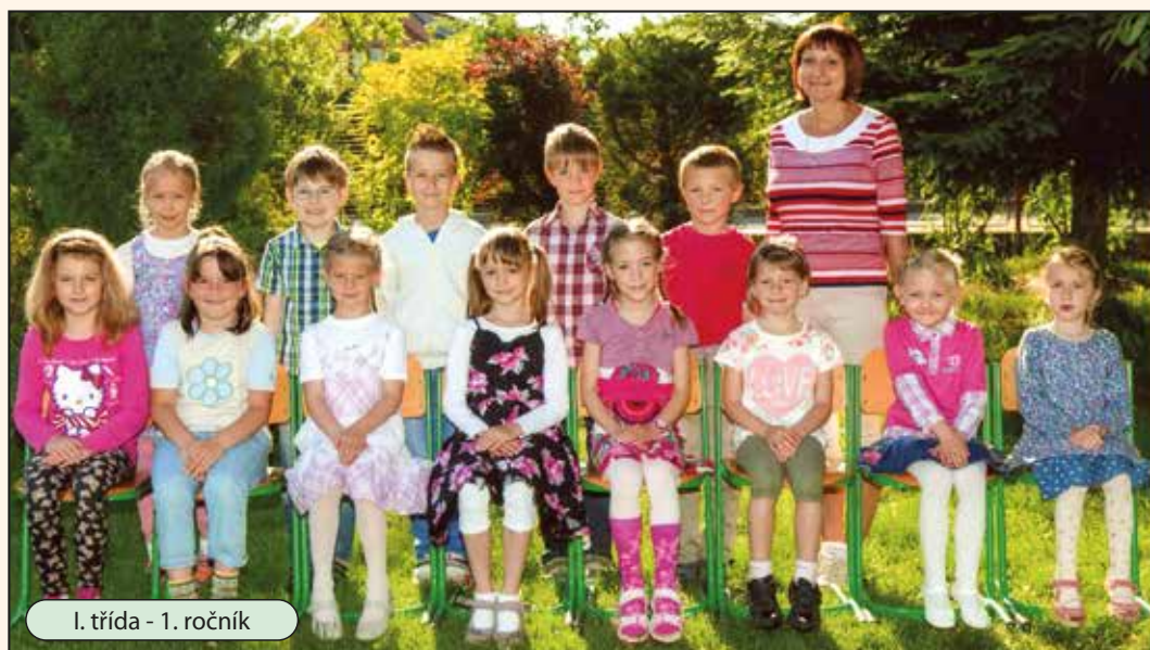
I. třída - 1. ročník