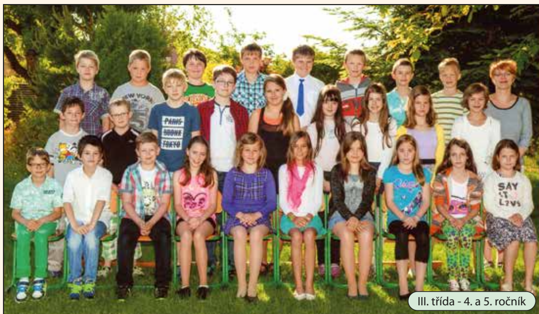
III. třída - 4. a 5. ročník