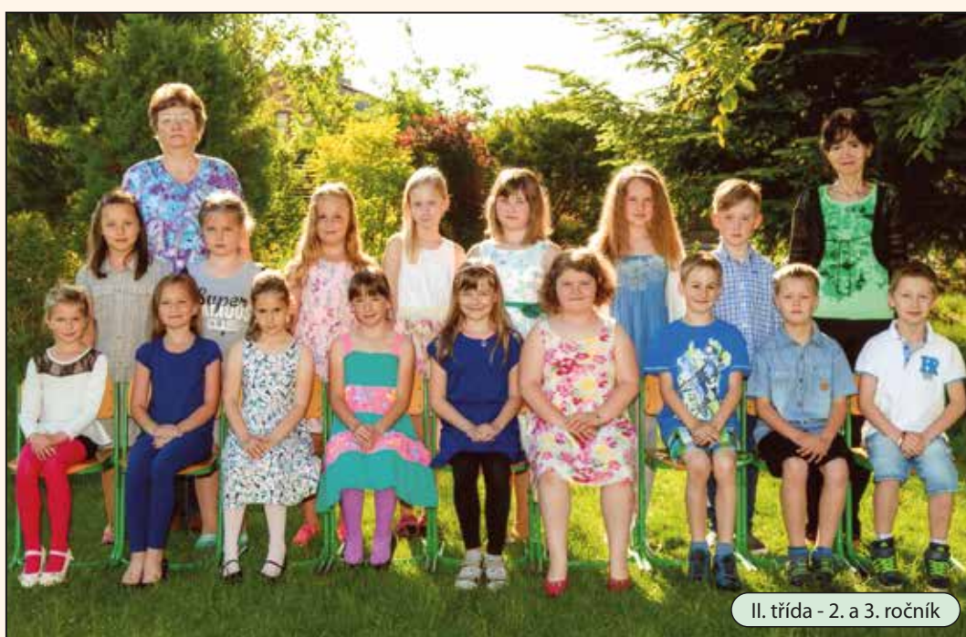
II. třída - 2. a 3. ročník