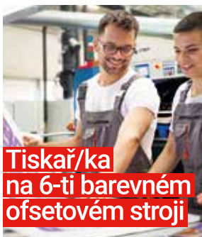
Tiskař/ka na 6-ti barevném ofsetovém stroji