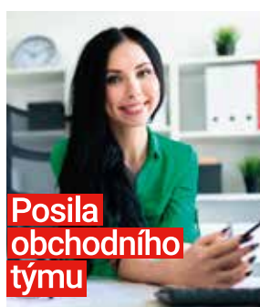
Posila obchodního týmu