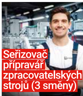
Seřizovač přípravář zpracovatelských strojů (3 směny)